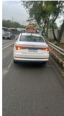
IMAGEM DA TRASEIRA