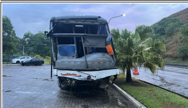
IMAGEM DA FRENTE