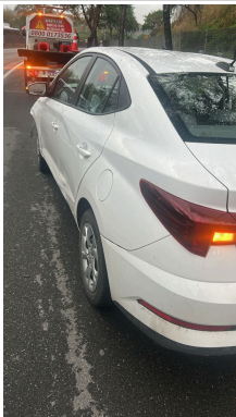
IMAGEM DA LATERAL ESQUERDA