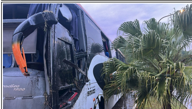
IMAGEM DA LATERAL ESQUERDA