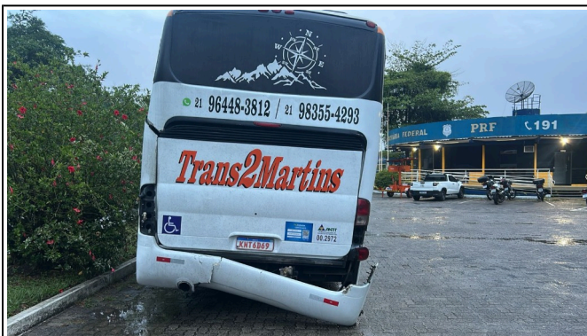
IMAGEM DA TRASEIRA