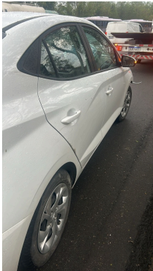
IMAGEM DA LATERAL DIREITA