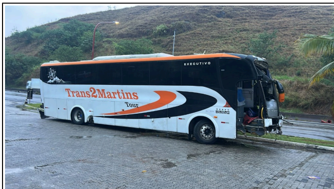
IMAGEM DA LATERAL DIREITA