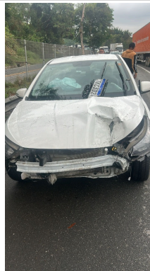
IMAGEM DA FRENTE